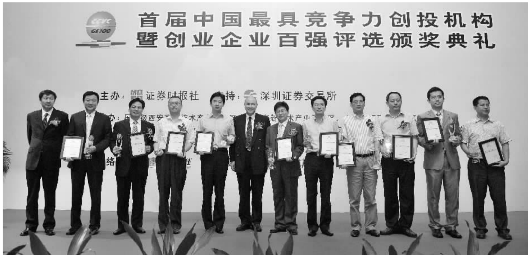
▲ 证券时报社长、总编辑温子建(左一)和中国证监会前首席顾问梁定邦(左六)为获评2009年度最具竞争力的创投机构(本土机构)颁奖