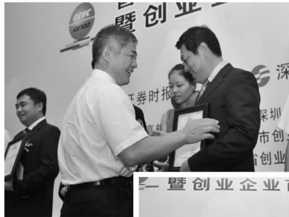
▲ 湖北省科技厅长王延觉(左二)为获得最具竞争力创投机构(外资机构)颁奖